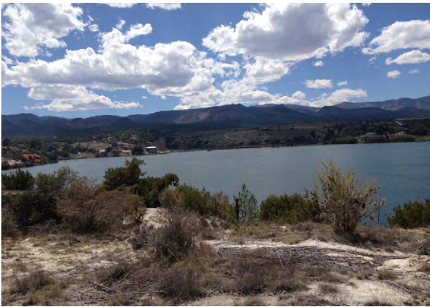
Figura 2. Vista panorámica de la laguna de Labradores, Galeana, Nuevo León (septiembre 2016).