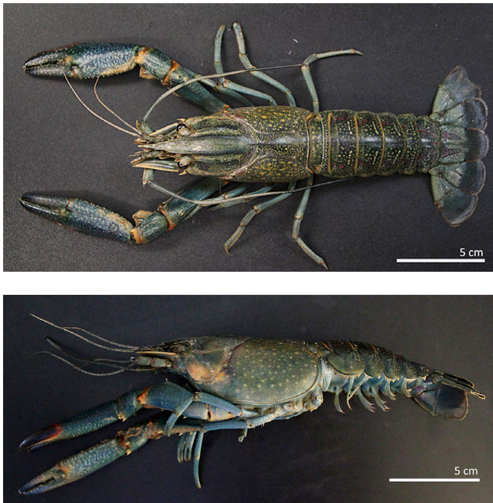
Figura 1. Vista dorsal (imagen superior) y lateral (imagen inferior) de una hembra de C. quadricarinatus de la laguna de Labradores, Galeana, Nuevo León.

Muchos países de Asia, África, Europa, Medio Oriente, Norte, Centro y Sur de América, incluyendo Australia, han importado y cultivado varias especies de Cherax con éxitos y fracasos (Ahyong y Yeo, 2007; Jaklic y Vrezec, 2011; Lawrence y Jones, 2002; Mendoza-Alfaro et al., 2011; Snovsky y Galil, 2011). Esta actividad ha provocado en algunos casos el escape de especímenes de granjas o centros de producción y su posterior establecimiento en ambientes silvestres de Bahamas, Colombia, Ecuador, Jamaica, México, Paraguay, Argentina, Puerto Rico, Filipinas, Singapur, Israel, Sudáfrica, Israel, Eslovenia y